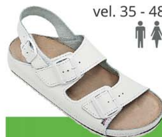
8 / AISON