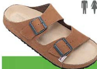
7 / FAETHON