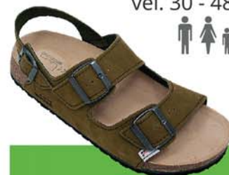
4 / FENIX