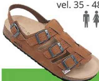
36 / NESTOR