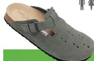
21-P / TITAN