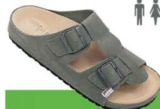
37 / DARES