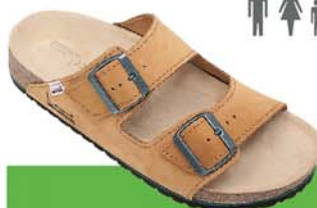
3 / ATYS