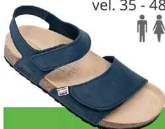
2-V / ROMULUS