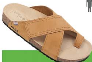
44 / ZEUS