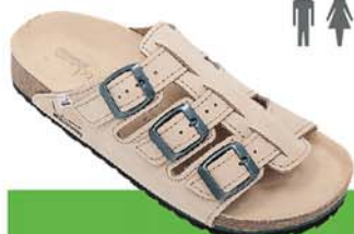
35 / BELOS