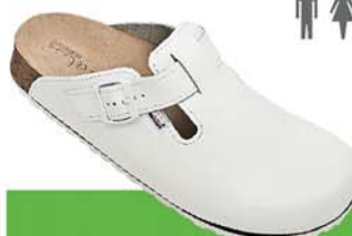
21 / TITAN