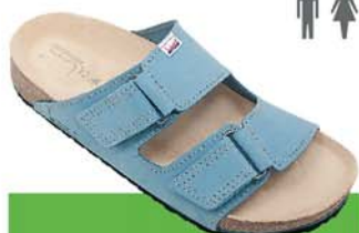
29-V / ATLAS