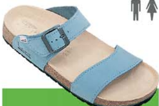
9 / SILVIA