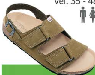
30-V / DAFNE