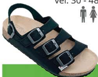
6 / PARIS