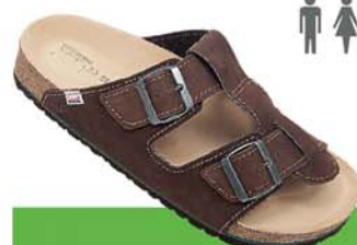
33 / EUROS