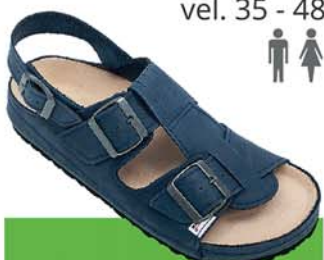
38 / FAUN