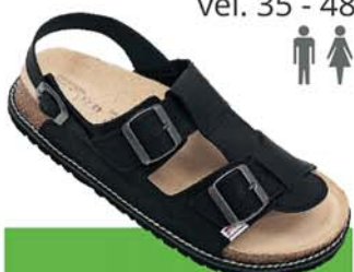
34 / JANUS