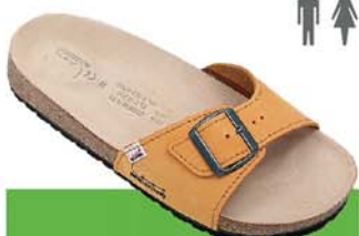
1 / LIBER