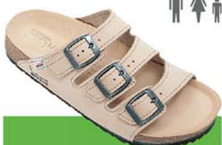
5 / IKAR